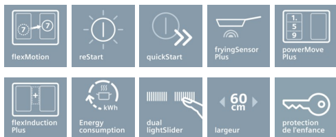
Table à induction avec de nouvelles fonctions innovantes, pour une grande flexibilité en toute situation.