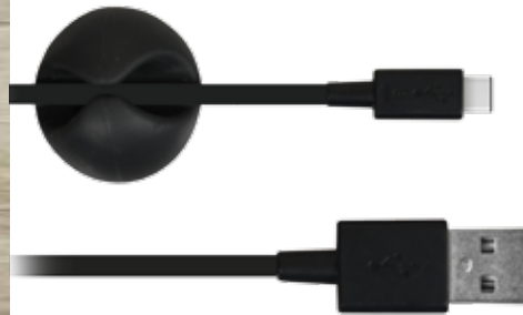
Included cable holder Range câble inclus