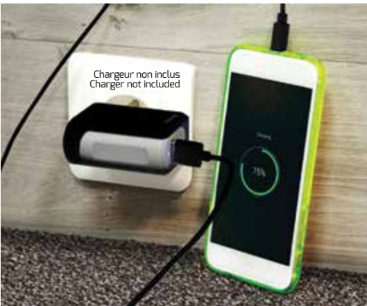
10 years warranty Garantie 10 ans