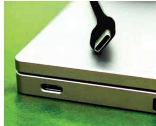
Macbook & Notebook compatible Compatible avec Macbook et Notebook