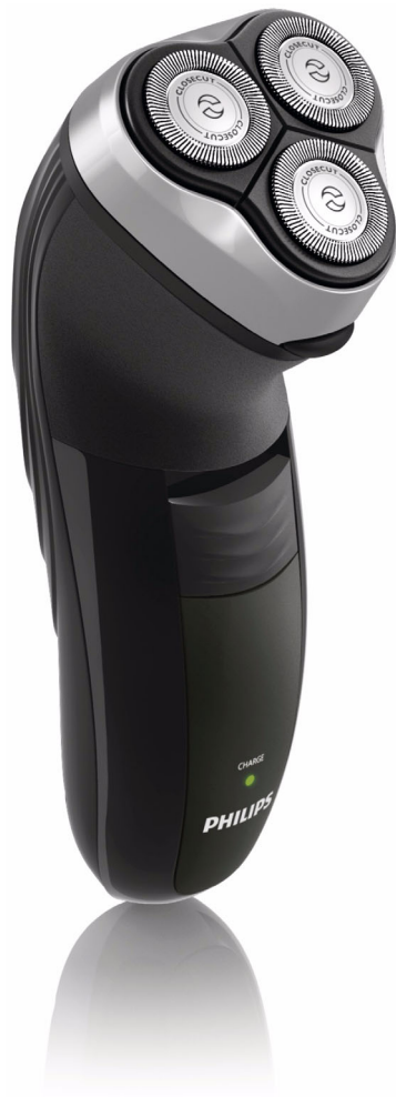
Philips Shaver 3000, CloseCut