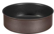
Sauteuse Ingenio 5 antiadhésif Ø 24 cm