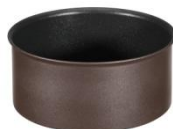
Casserole Ingenio 5 antiadhésif Ø 16 cm, Ø 18 cm et Ø 20 cm