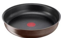
Poêle Ingenio 5 antiadhésif Ø 24 cm et Ø 28 cm